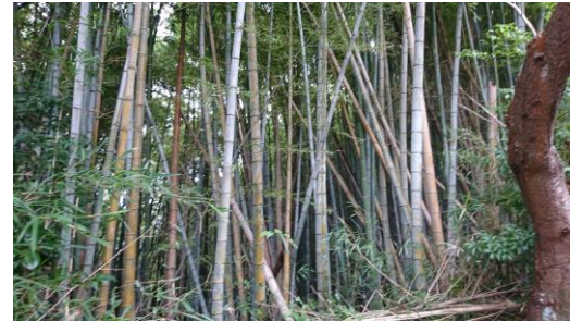
ほうちちくりん 放置竹林

静岡市街地にある谷津山を市民の憩いの場になるよう、また野生生物の良好な生息環境となるように、放置竹林の整備や広葉樹等の植栽を行って、谷津山を静岡市のシンボリックな緑地になるように活動している会員60名の団体です。