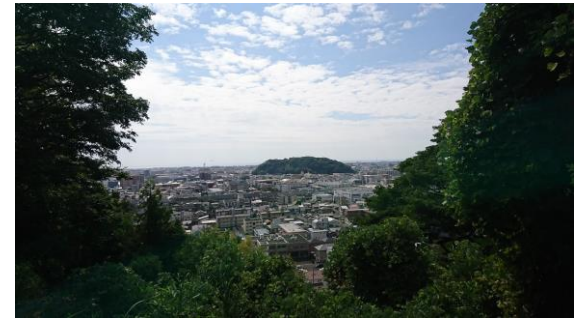
谷津山からみえる景色